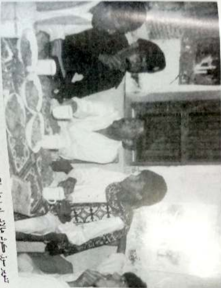
تقویر سوز، سکوتر ہالائی، امید علی لکھو پی سوز ہالائی، ہالائی پر سکر سکریت ایوارڈ جمی تقویر سوز کانستوریہ ہالائی، جمی تقویر سوز