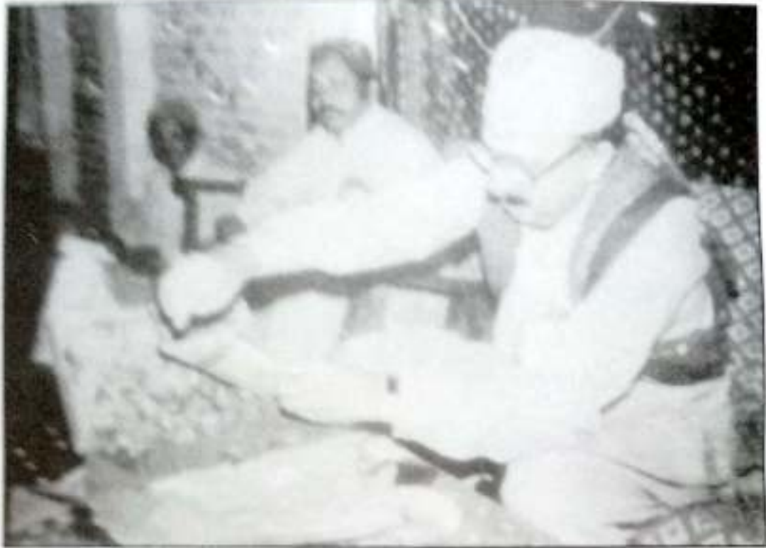
قبل سائين مخدوم طالب الموليٰ ۽ سوز هالائي "رنگ رتا پيچرا" جي مهورات هڻندي