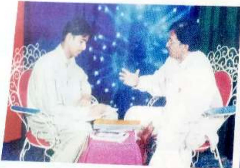
سوز هالائي کان شعيب اڀڙو انٽرويو وٺندي