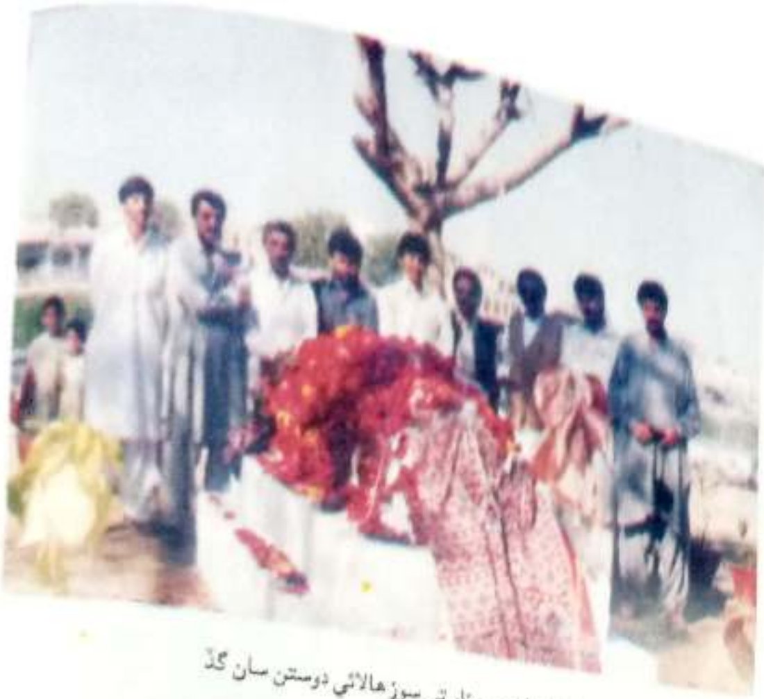
شيخ اياز جي مزار تي سوز ھالائي دوستن سان گڏ