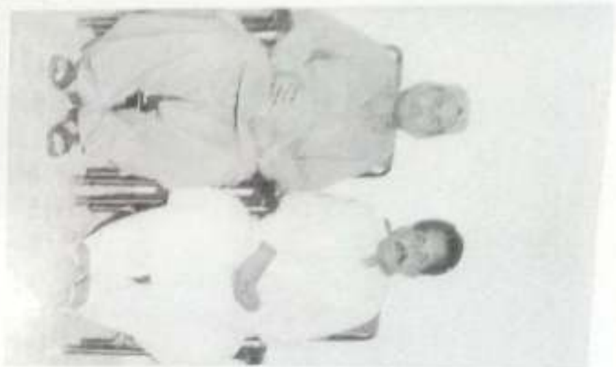
سویڈن ہالائی جو تقویر احمد شیخ