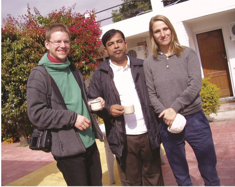
نيٺا ۽ پيٽي سان گڏ