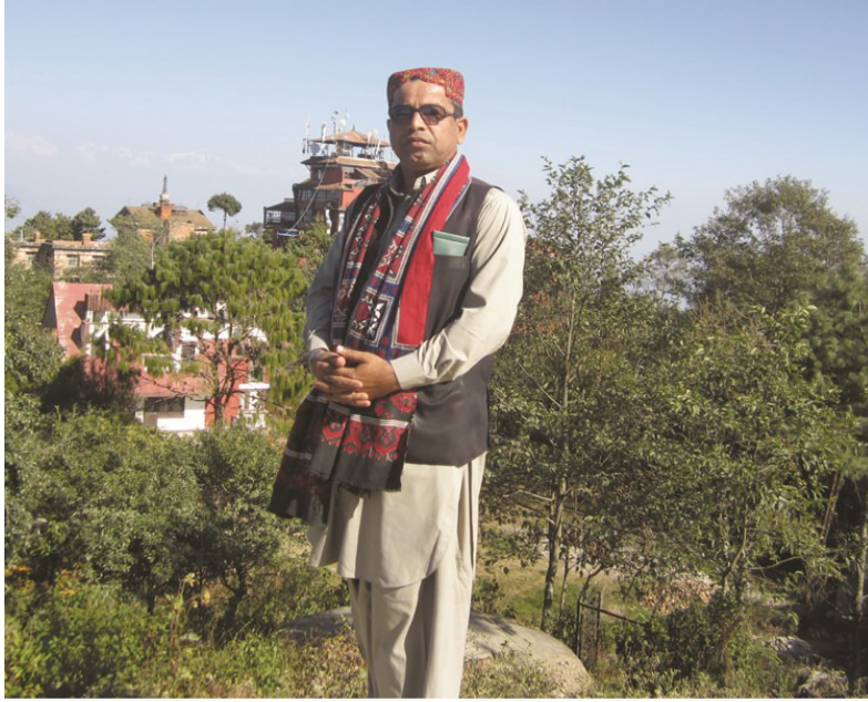
هوتل ماڻوئين ويونگر ڪوٽ ۽ هماليه جبل جي سامهون