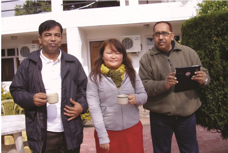
ابوريجان ۽ نيليمي راءِ سان گڏ