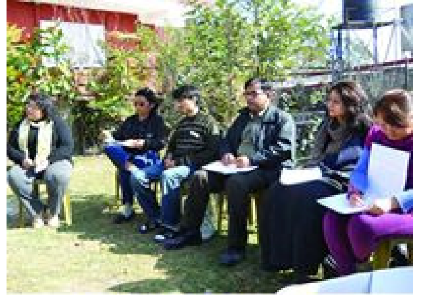
ٽريننگ حاصل ڪندڙ گروپ سان گڏ ننگر ڪوٽ