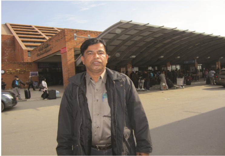
تري پون انٽرنيشنل ايئرپورٽ ڪٽمڊو