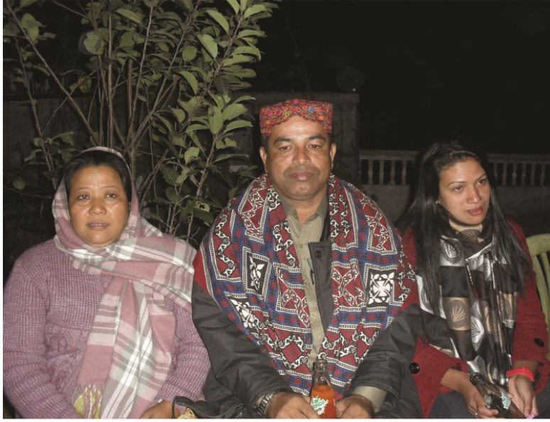
ٻن نپالي عورتن سان محفل دوران ننگرڪوٽ