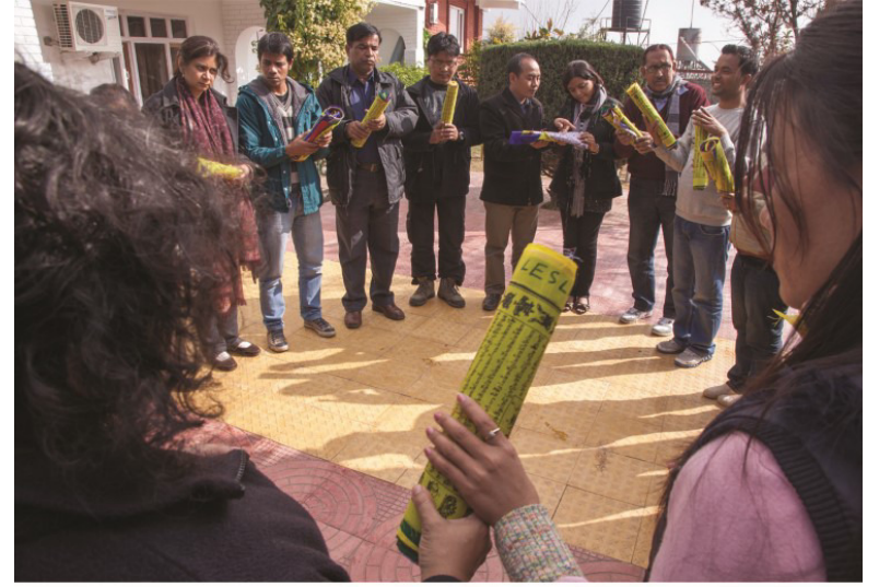
ڀڳتا جي جهندين جي دعائين سروس دوران