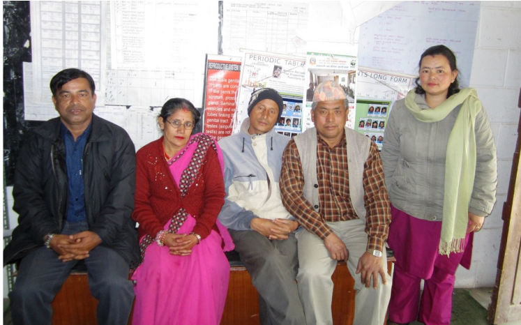
نگرڪوٽ اسڪول جي پرنسپال ۽ اسٽاف سان گڏ

ڪمري مان نڪري گهڙي ڪن ريسٽوران ۾ اچي ويٺاسين. مون اجازت گهري ته خاموشي سان ٽڪ ٻڌي ڏسندي رهي. ڪجهه پنڌ گڏ آياسين ته واپس ورڻ لاءِ بيهي رهي. چيائين ته ”تو کي اجازت آهي. جيترا ڏينهن به آهيو. ٿورو وقت ڪڍي مون وٽ ضرور اچجو.“ آئون هوٽل تي موٽي آيس ته لنچ تي دوست گڏجڻ شروع ٿي ويا هيا.