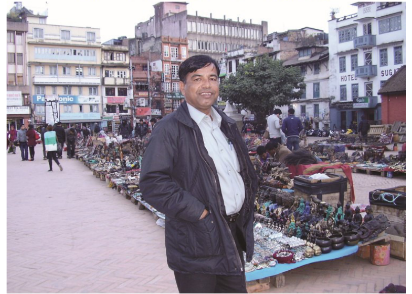
دربار اسڪوائر ڪٽمنبو ۾