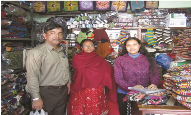
ڀڳتاپور جي بازار ۾ خريداري ۽ دوڪاندار ماءُ ۽ ڌيءَ سان گڏ