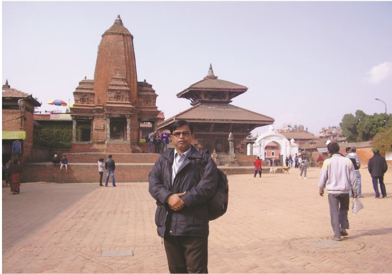
درٻار اسڪوائر پڳتاپور