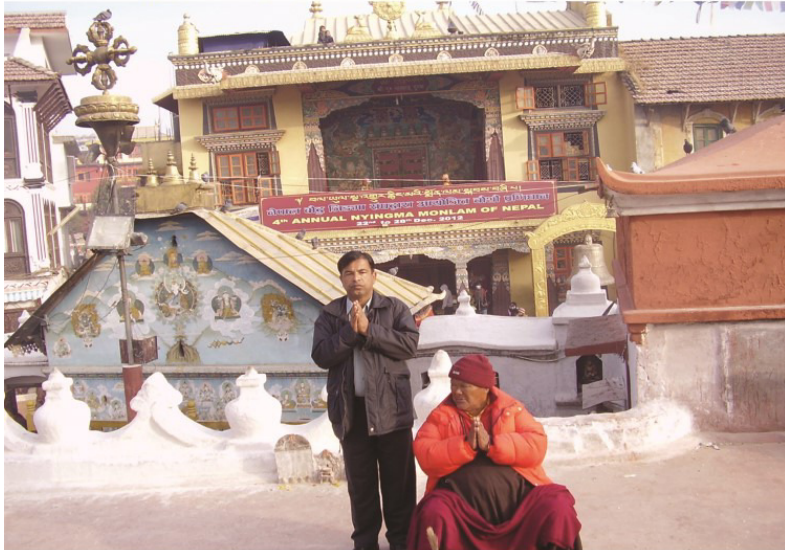
ٻڌانات ٽيمپل جي سامهون هڪ ٻڌ پوڄاري سان گڏ