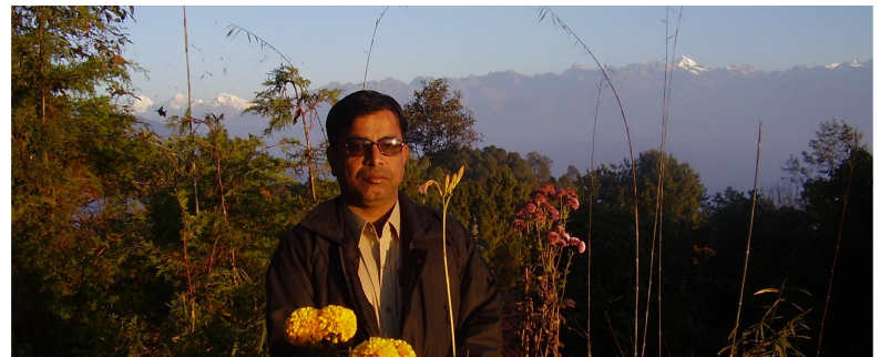
ننگرڪوٽ ماڻوٽ ايوريست جي سامهون

اڪيليون عورتون، گهاٽن پيلن، ڊگهن وڻن سان گهيريل جابلو رستن تي گهر جو سيدو سامان، ڪيبن ۽ دوڪان جو سامان موٽر سائيڪلن تي کڻي ويندي نظر اچن ٿيون. ڪن عورتن سان گڏ اسڪولي ٻارڙا به نظر اچن ٿا. اڪيلي عورت، نوجوان چوڪريءَ جو موٽر سائيڪل تي سفر ۽ مرد سان گڏ سفر عام رواجي نظر اچي ٿو. اسين پنهنجي معاشري ۾ اڪيلي عورت جو موٽرسائيڪل هلائڻ جو تصور به نه ٿا ڪري سگهون. اسان جي سماج ۾ جيڪڏهن ڪا عورت دوڪان وغيره هلائي به ٿي ته ان کي ڪافي تڪليفن مان گذرڻو پوي ٿو.