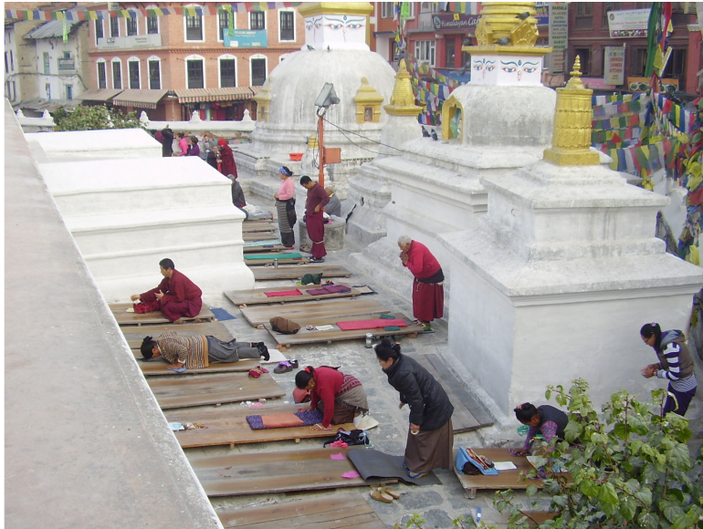
ٻُڌانات ٽيمپل ۾ عبادت جو منظر

ڊنر تي صدف کي ٻڌايم ته ”لمبيني، پوکرا ۽ نيپال گنج جو خوبصورت تصور ۽ خواب ڪٿي موٽي ويندس ۽ اها اميد به ڪٿي ويندس ته ٻيهر موٽي ايندس.“