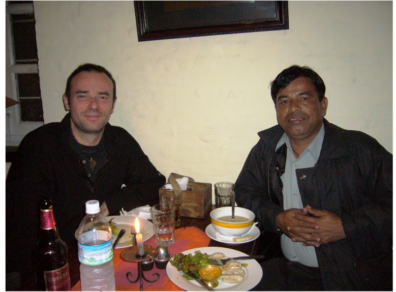
فرانس جي بهترين موسيقار ٿامس ڊويگنيو سان

دوران اگر پرهيز ڪئي هئي ته پورڪ ۽ شراب کان ڪئي هئي. پر حقيقت اها آهي ته مونکي ڪراچي جي فاران، عثمانيه هوٽلن جي ماني ۽ اسٽوڊنٽ برياني ياد اچي وئي. ٽيپهريءَ جو ٽائيم اچي ٿيو هو. اسان عليم الدين کان اجازت ورتي. انتهائي عقيديت، پيار ۽ دعائن سان خدا حافظ ڪيائين. ٽڪاوت جو احساس ٿيڻ لڳو هيو. ٽيڪسي ڪري گيسٽ هائوس موٽي آياسين. جتي بڪالپا طرفان اسان جي مان ۾ پُروڦار الوداعي تقريب رٿيل هئي.