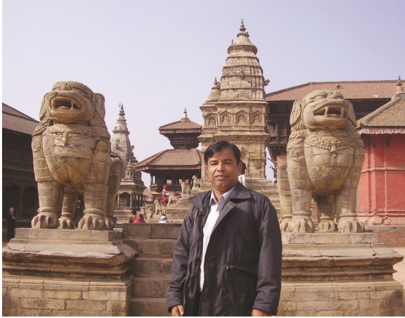
پڳتاپور جي هڪ ٽيمپل جي سامهون