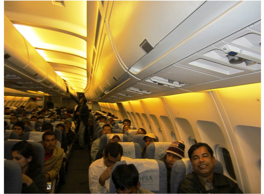
پي آئي اي جي جهاز ۾ سفر دوران

ڪن ٿيون ۽ سامان کڻائڻ ٿيون. جنهن مان معلوم ٿئي ٿو ته هن اين جي او جو گهڻو تڙو اسٽاف عورتن تي مشتمل آهي. ايئرپورٽ کان ايندي مون کي محسوس ٿيو ته ننڍي وڏي ڪاروبار ۾ عورتن جي اڪثريت آهي. چوٽه هر ٻي موٽرسائيڪل مون عورت يا چوڪرين کي هلائيندي ڏٺي. هر ٻئي مرد سان گڏ موٽر سائيڪل تي مون کي عورت ئي ڏسڻ ۾ آئي.