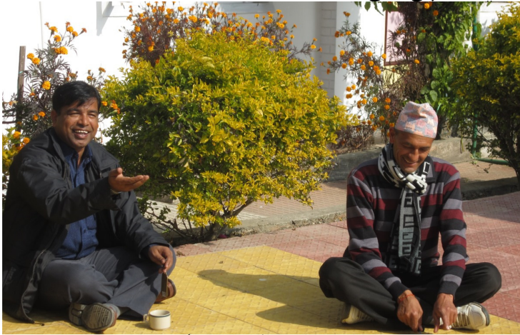
سيداراج پانڪ سان گڏ خوشگوار موڊ ۾

”Really you are lucky man“ واقعي تون تمام گهڻو خوش نصيب آهين. رات ڪافي گذري ويئي هئي، ڳالهيون ڪندي ڪندي ننڊ اچي وئي.