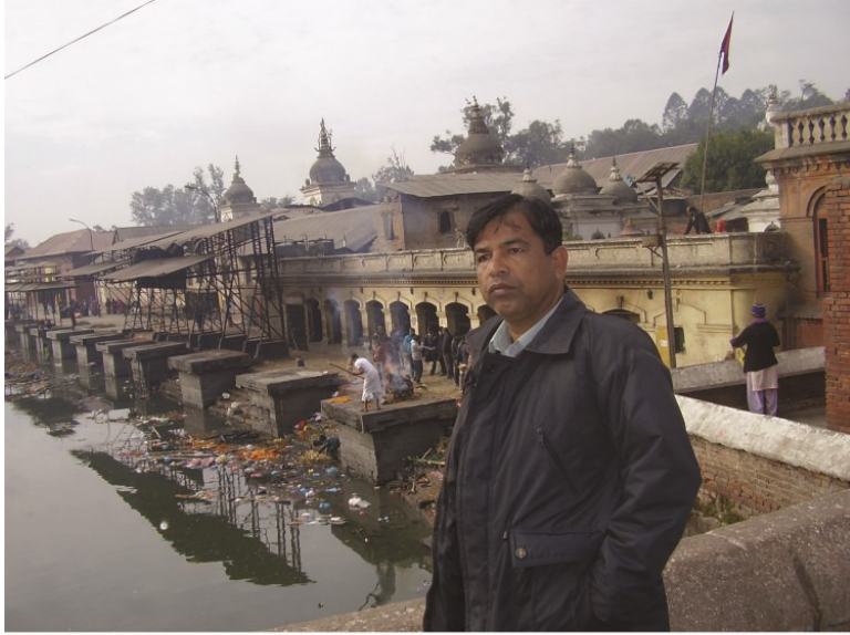
پاڳمتي ندي جي مڪ شمشان گهاٽ تي