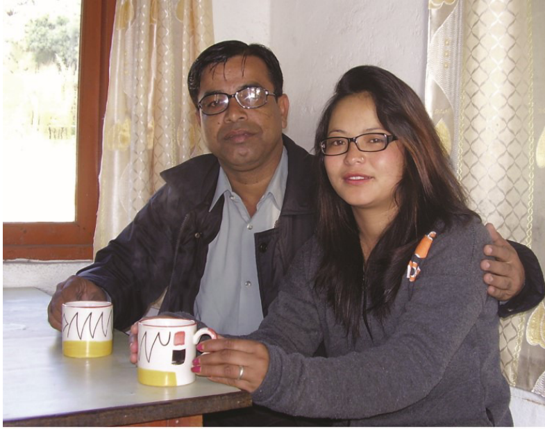
لمسفيدي جي ديوي شانتني لاما سان سندس ريسٽوران ۾