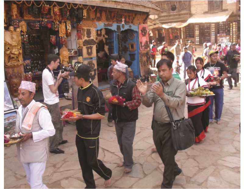
ڀڳتا پور ۾ هڪ فيسٽيول دوران