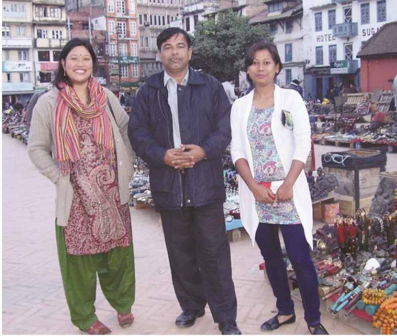
بندانا ۽ گنگا سان گڏ دربار اسڪوائر ڪٽمنبو ۾