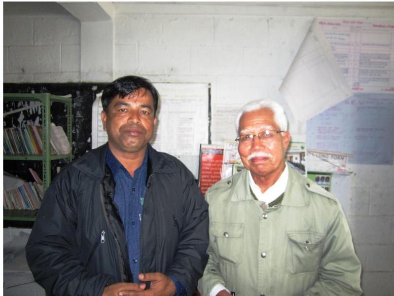
شيو جي نڀالي پرڏان سان گڏ ننگرڪوٽ ۾

اسان جي شاعرن ۽ ليکڪن کي رڳو فطرت، ديوين، ديوتائن ۽ عشقيه لوڪ ڪهاڻيون لکڻ تائين محدود ڪري ڇڏيو آهي. پر انهي جي باوجود به اسان وٽ اڄ به سگههرا ۽ سُنا شاعر ۽ ليکڪ موجود آهن. پر پوءِ به اسان علائقائي اعتبار سان ڀارت، بنگلاديش ۽ پاڪستان جو مقابلو نه ٿا ڪري سگهون.“ ٿڌ به تمام گهڻي ٿيندي پئي ويئي. ڪافي دير ٿي وئي هئي اسان به پنهنجن پنهنجن ڪمرن ۾ وڃي آرامي ٿياسين.