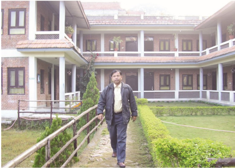
بڪالپا جي گيسٽ هائوس کان ٻاهر ايندي