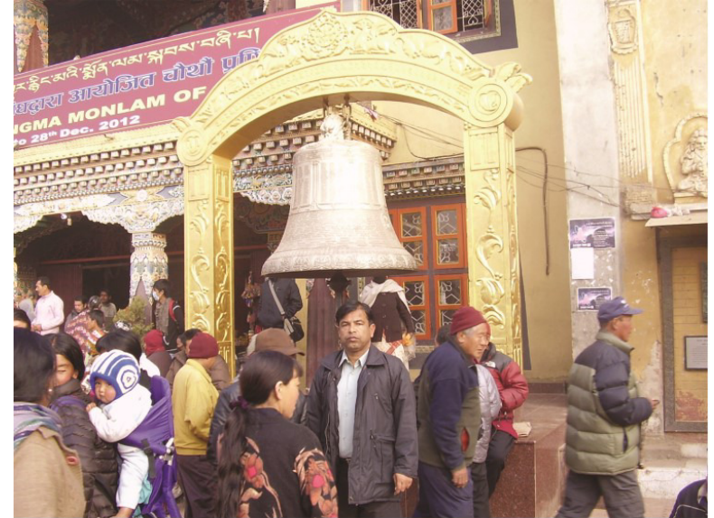
ڀڳدانات ٽيمپل جي مڪ گھنڊ جي اڳيان