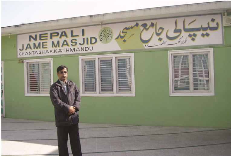
جامع مسجد کٽمنڊو