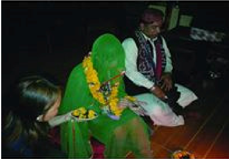
ثقافتي پروگرام دوران شادي جون رسمون ادا ڪندي