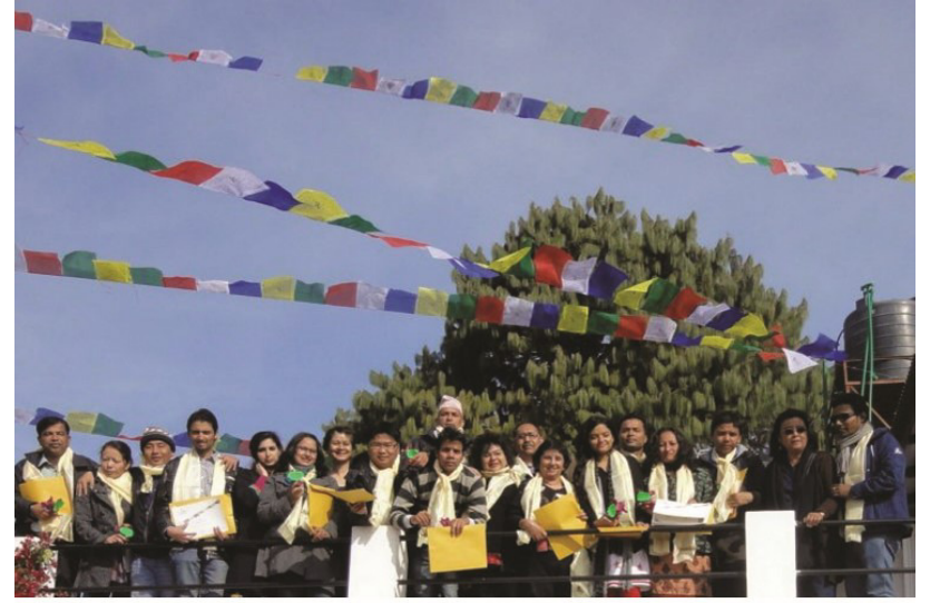
ٽريننگ جي آخري ڏينهن تي ورتل گروپ فوٽو ننگرڪوٽ