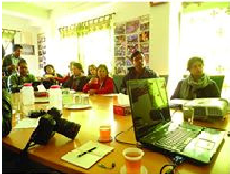
ڪٽمندا ور هڪ ڏين جي او جي پروگرام ۾