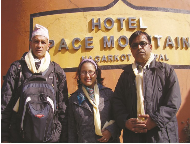
انوجا ۽ سڌاراڄ سان گڏ