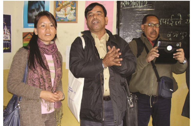
لامين لاما ۽ ابوريجان البيروني سان گڏ