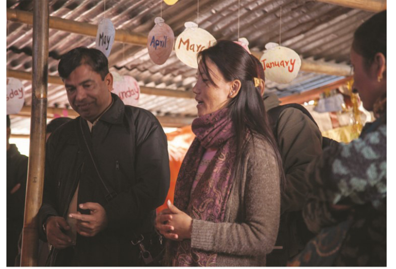
لامين لاما سان گڏ اسڪول ورت ڪندي