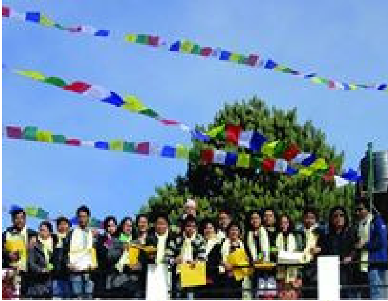
ٿريننگ جي آخري ڏينهن تي ورتل گروپ فوٽو ننگرڪوٽ