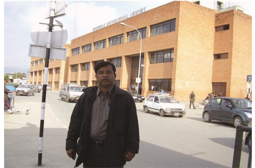
ڪٽمنڊو ايئرپورٽ جو ٻاهريون ڏيک