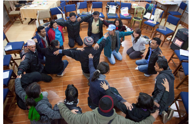
عالمي انساني حقن جي ڏينهن جي موقعي تي