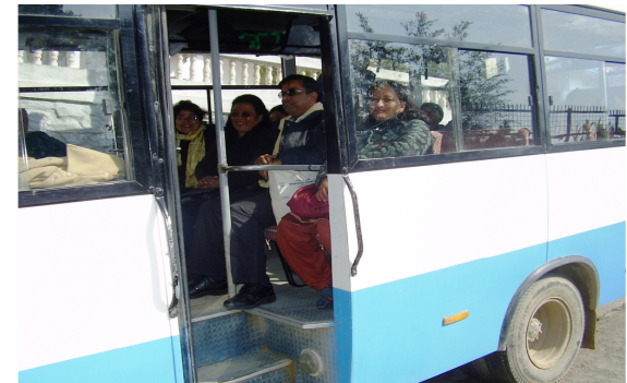
بس ۾ سير و تفريح دوران .