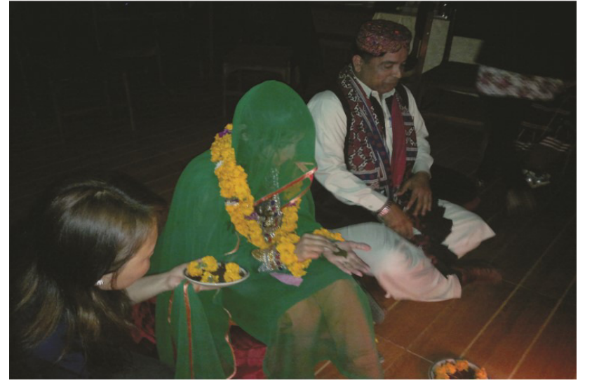
ثقافتي پروگرام دوران شادي جون رسمون ادا ڪندي