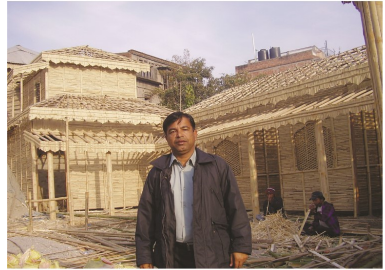
ڪاٺ ۽ ٻانڌ سان ٺهندڙ ڊبل اسٽوري بلڊنگ