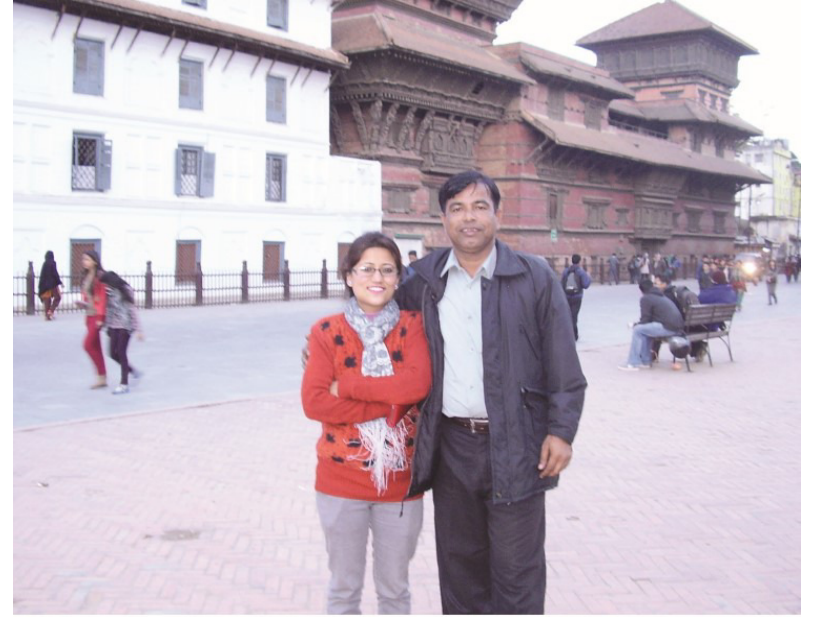
پرويا (پروا) سان گڏ دربار اسڪوائر ڪٽمنبو ۾