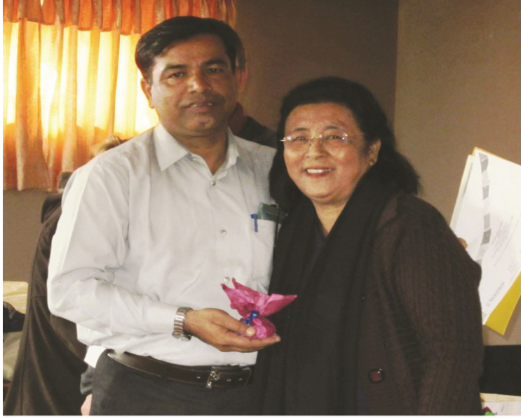
مئڊم اسٽيلا تمنگ کان سرٽيفڪيٽ وٺندي