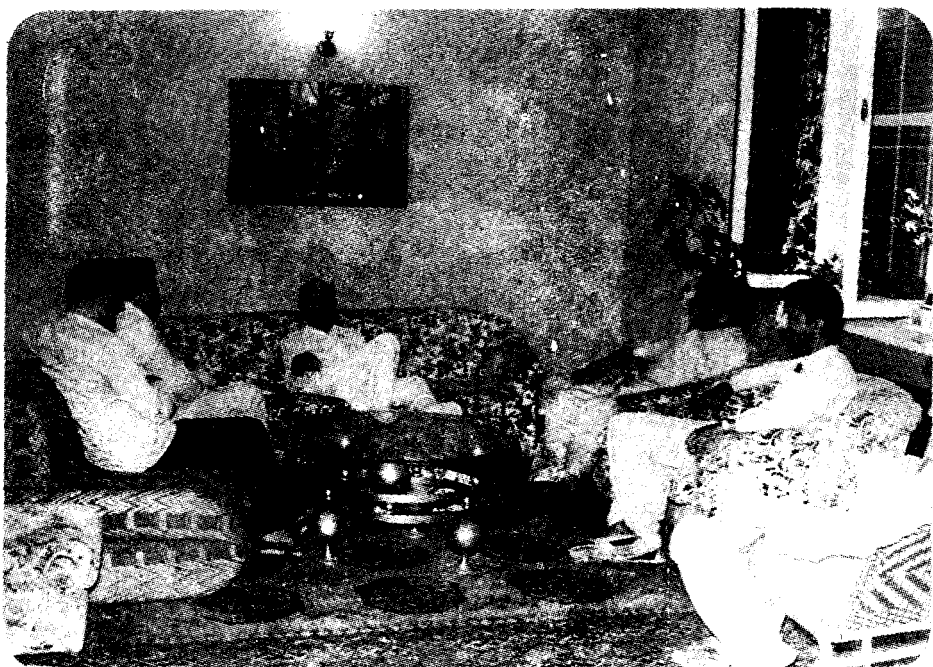
مصنف حيدر منزل تي هڪ محفل ۾