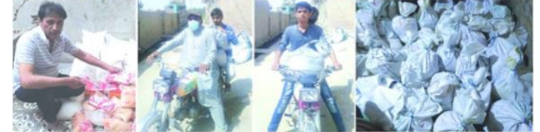
2010ع جي مها ٻوڏ، 2020ع ۾ ڪورونا ۽ مختلف وقتن تي متاثرن جي مدد دوران