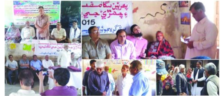
مختلف وقتن تي ڄمڙي ۽ شگر جي ڪئمپون