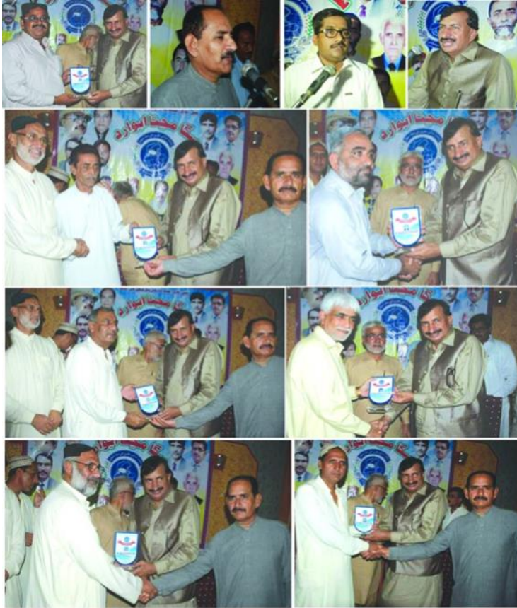
سگا شاخ شهدادڪوٽ طرفان نمايان سماجي خدمتن جي مڃتا طور سگا شهدادڪوٽ جي سائين کي ايوارڊ