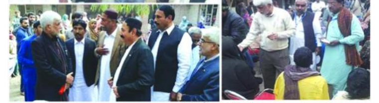
مختلف وقتن تي لڳايل اڪين جون ڪئمپون