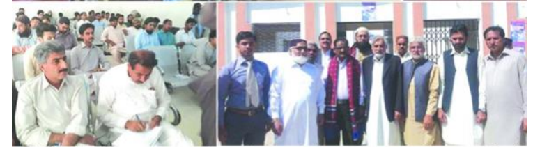
استادن، صحافين ۽ سماجي ڪارڪن جي لاءِ مختلف تربيتي ۽ سکيا جا پروگرام