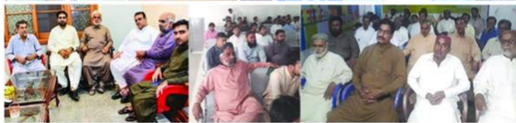
ضمير ڪرل جي ياد ۾ تعزيتي پروگرام