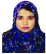
صنم ناز جوڻيجو