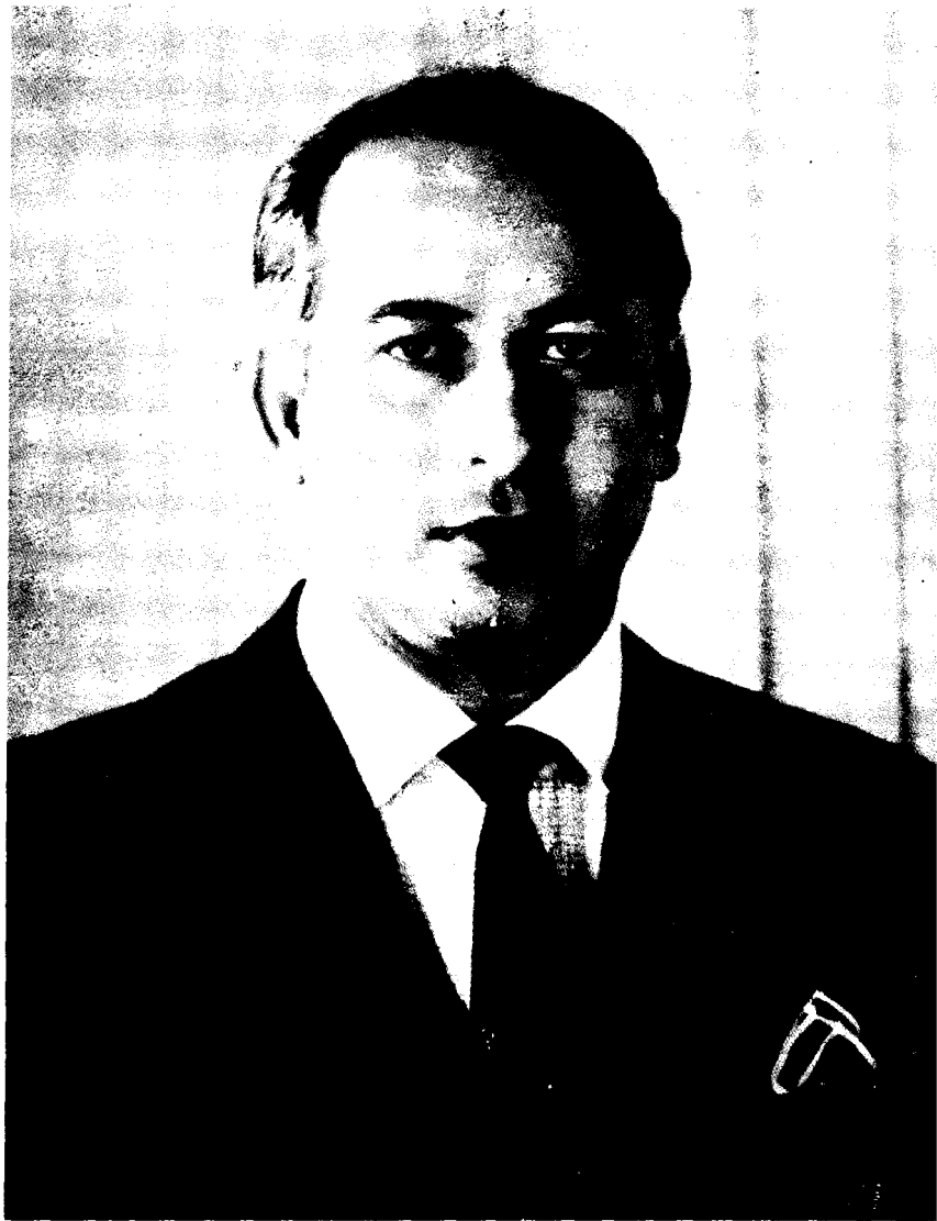
قائد عوام ذوالفقار علي ڀٽو