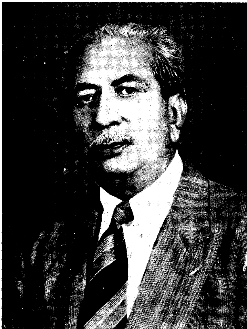
سر شاهنواز خان پٽو