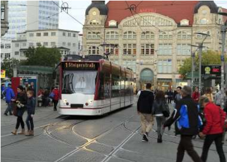
اوڊيسا شهر جي هڪ خوبصورت اڏاوت