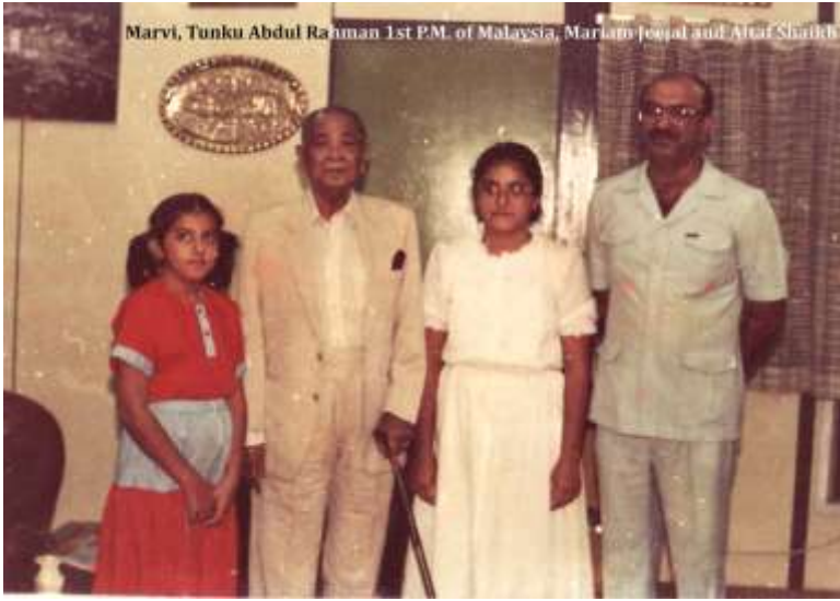
ملائيشيا جي پهرين وزير اعظم تنڪو عبدالرحمان سان گڏ الطاف شيخ ۽ سندس ٻار