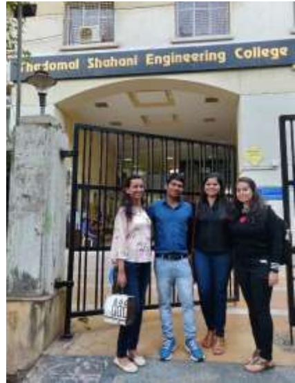
سپيني سنڌين جو تڌومل شاهائي انجنيئرنگ ڪاليج