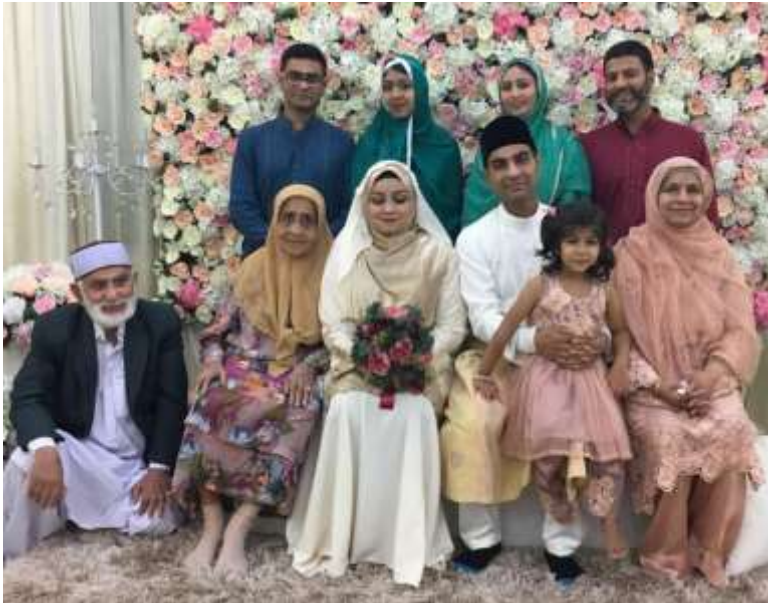
پروفيسر محمد عمر چند پنهنجي گهرواري ۽ گهوت پٽ عثمان مجتبيٰ سان گڏ ملائيشيا ۾