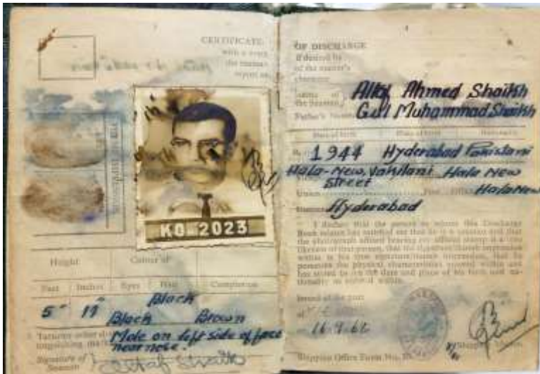
الطاف شيخ جو CDC ڪتاب جنهن جو نمبر پڻ 2023 آهي