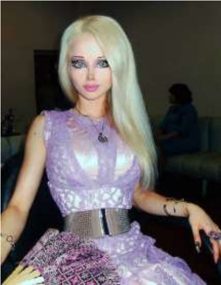
باربي ڊال جهڙي چوڪري ولبيريا لڪيائو ڪي ڏسڻ لاءِ دنيا جا سياح هن شهر اوڊيسيا ۾ اچن ٿا