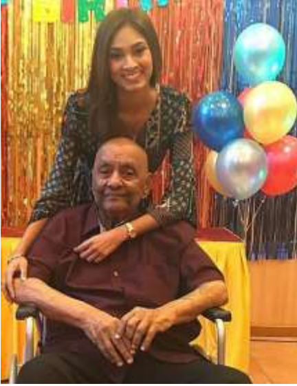
سنگاپور جو ڦاهي ڏيندڙ درشن سنگهه برت ڊي تي پنهنجي ائڌلٽي ڏوهتي پوڄا سان گڏ