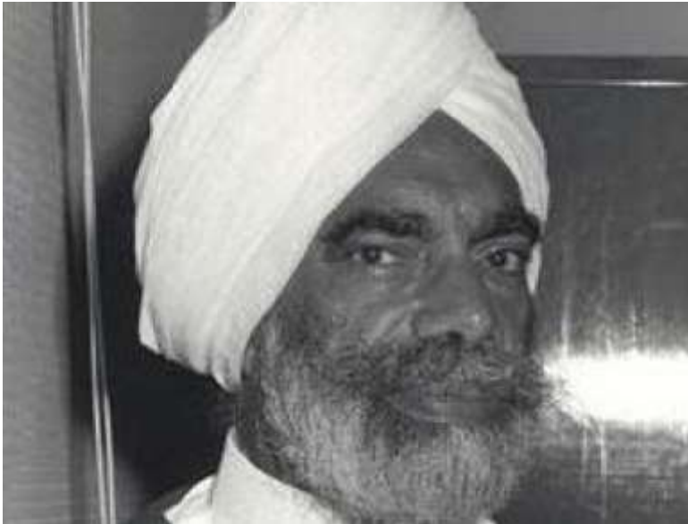
سنگاپور جي هاءِ ڪورٽ جو سِڪُ چيف جسٽس چور سنگھ