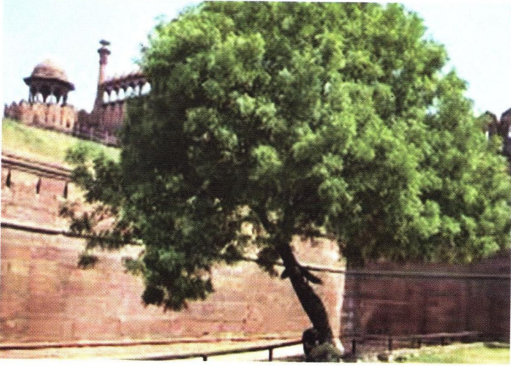
نمر جو وڻ