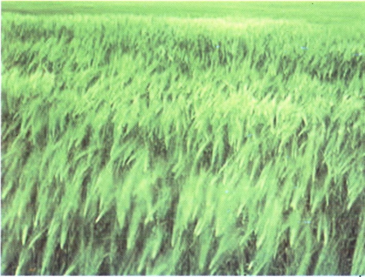
ڪڙڪ جا آڀو