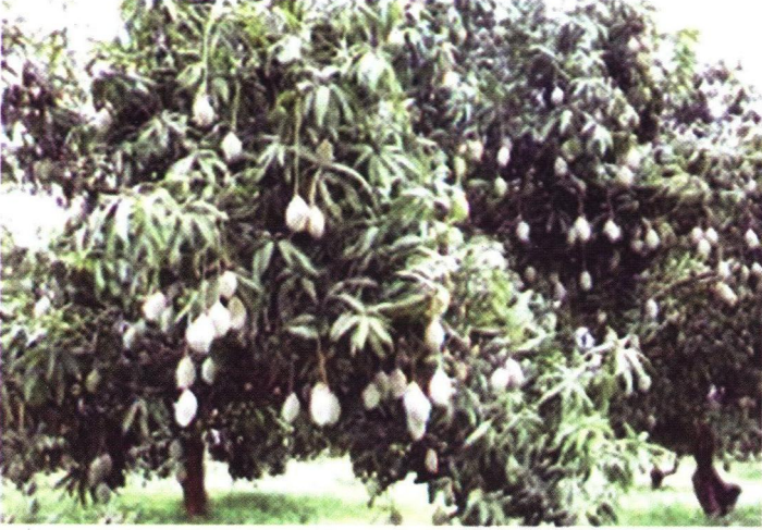
انڊ انيڙين سميت