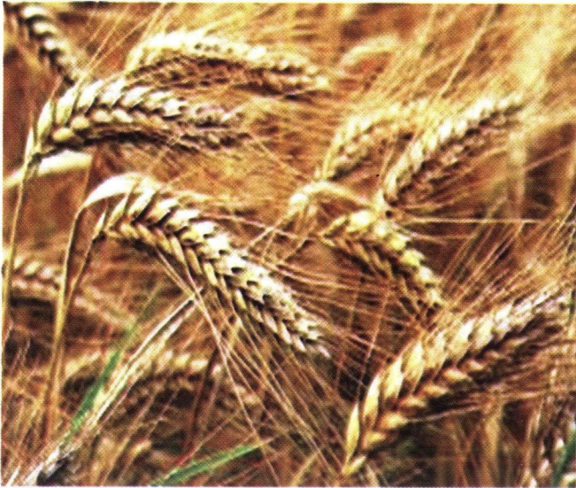
ڪڙڪ جا پڪل سنگ