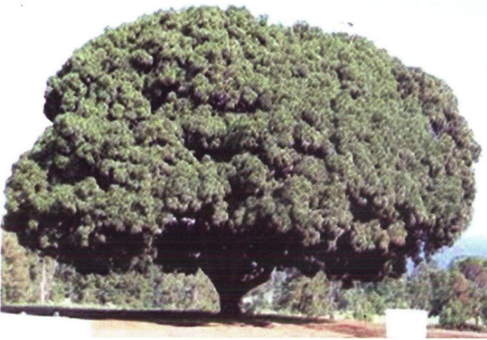
انڊ جو وڻ