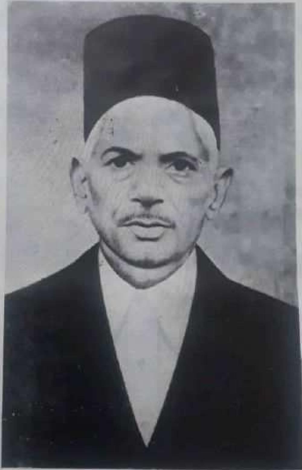
مهاکوي کشنچند 'پيوس'