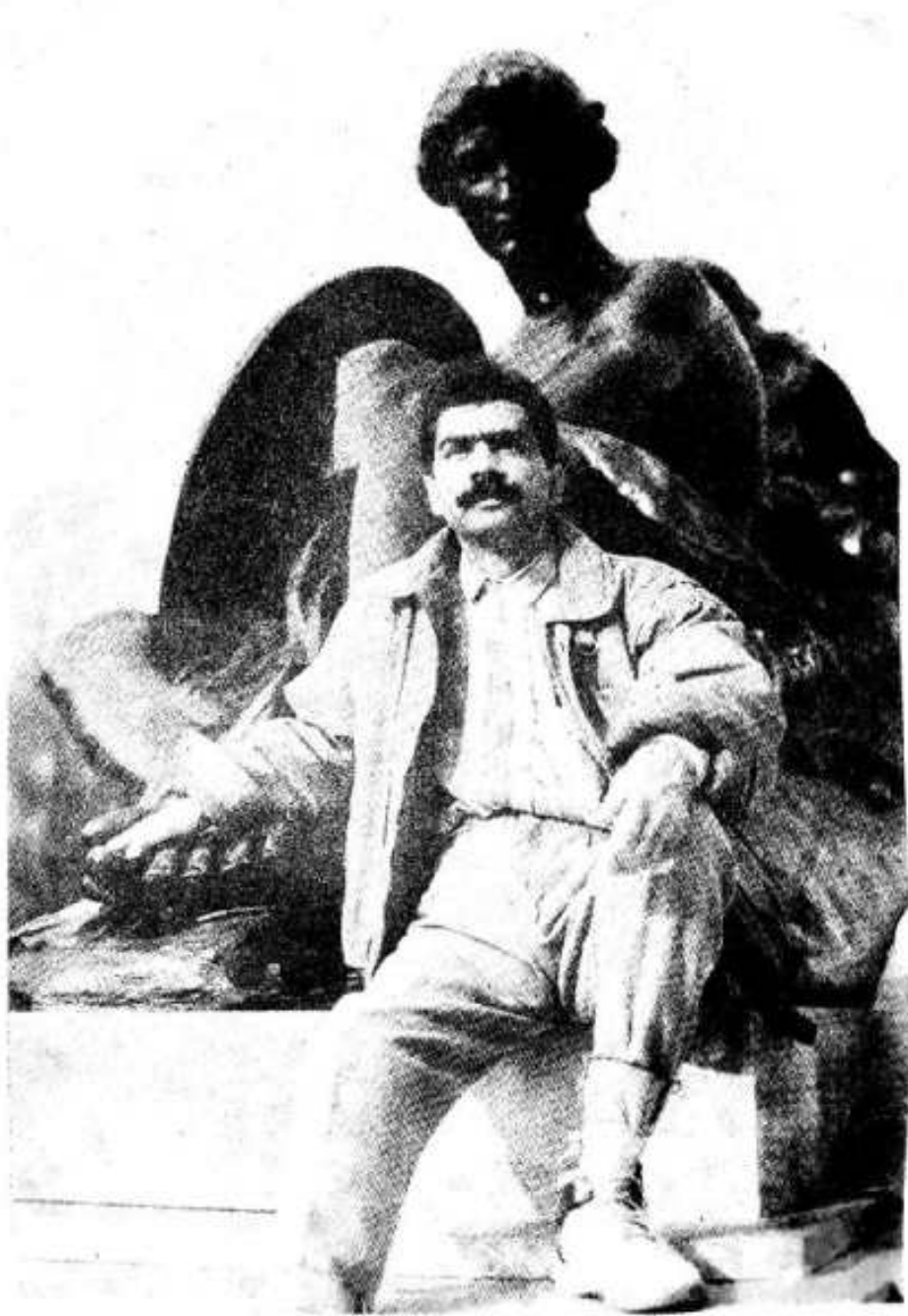
بڪنگهم پيلس جي چوڪ تي لهيل مجسمي ۾ سان.