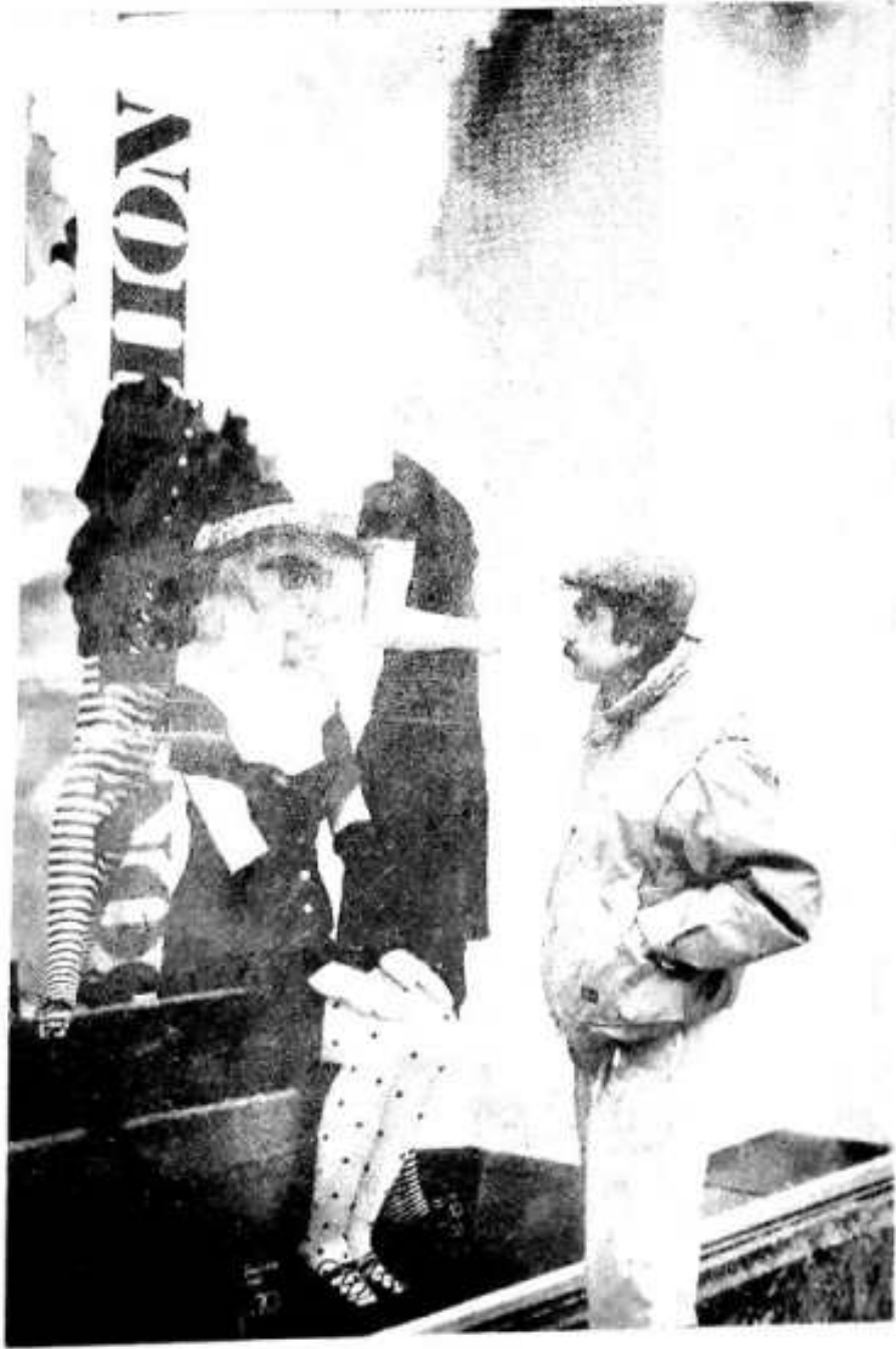
ٺاٺينس ٻرج شاينگ سينٽر جي دڪان ۾ رڪيل مجسمن آڏو.