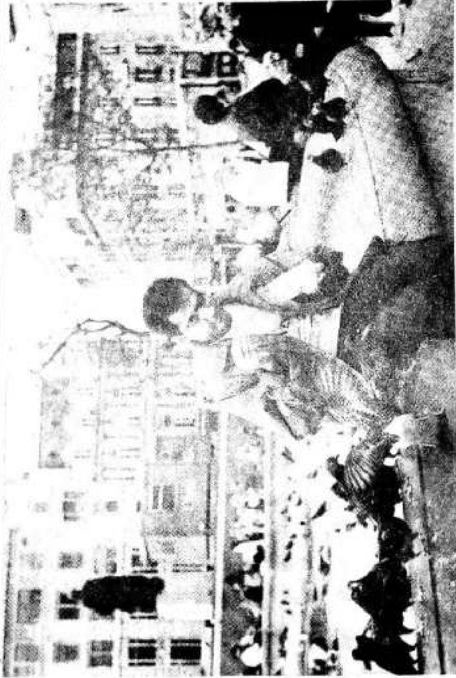
ٲرافلگر اسڪوائر تي ڪهون سان ڪچهري.