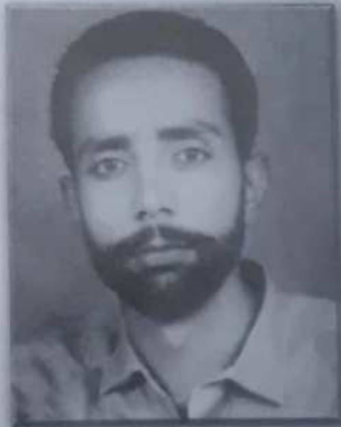
سرڪش سنڌي 1965ع ۾