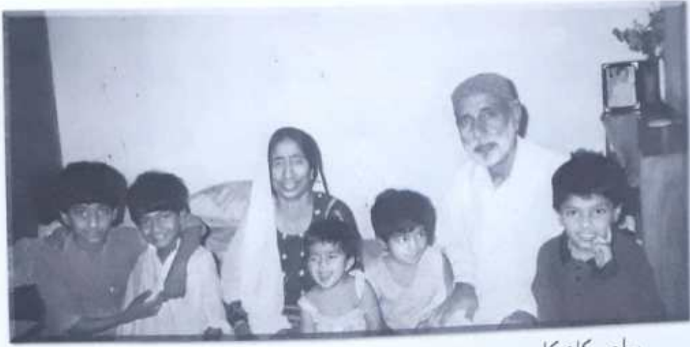
ساڄي کان کاڀي: منصور، سرڪش سنڌي، ڪيٽيجهر، انا، عمراهم، هالار ۽ منصور