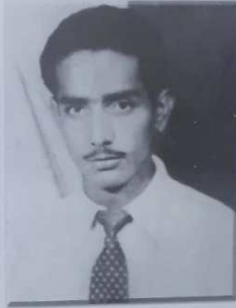
سرڪش سنڌي 1957 ع ۾