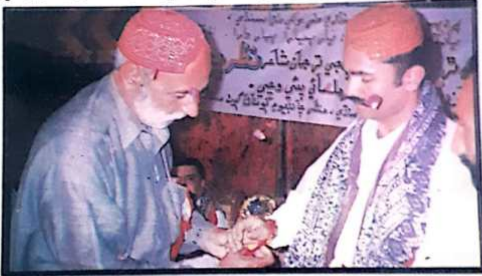
سرکش سنڌي نظر پياسيءَ کي ڳانو ٻڌندي