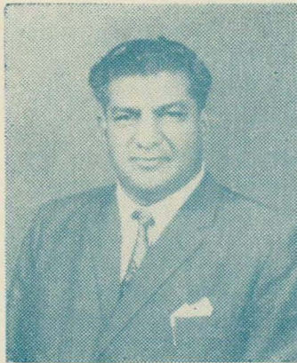
سومر اقوم جو عظيم فرزند الحاج سيٺ ولي محمد سومر و