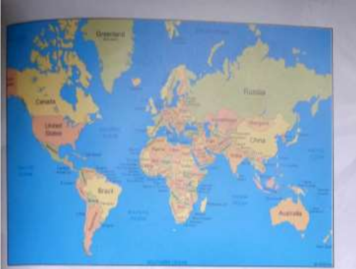
دنيا جو نقشو