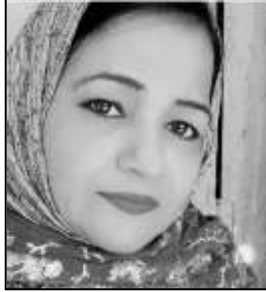
ايس نسيم ميمڻ