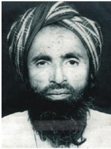
استاد منشار فقير