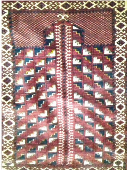
پیرو فقیر شورور جو مصلو