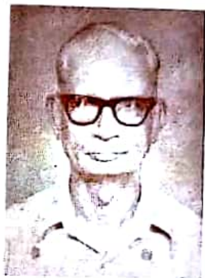
سرگواسي چمترا م بولچند تھار اماڻي