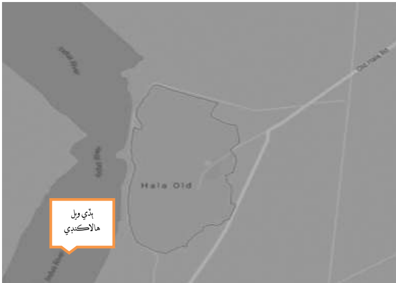
گوگل تان ورتل هالا پراڻا جو نقشو

هالا ڪنڊي جي دريا حوالي ٿيڻ کان پوءِ اتان جا رهواسي لڏي اچي موجوده هالا پراڻا ۾ ويٺا. ان هالا پراڻا جي ذڪر کان پهرئين مناسب رهندو ته هالا ڪنڊي جي اهم مشاهيرن جو احوال پيش ڪجي.